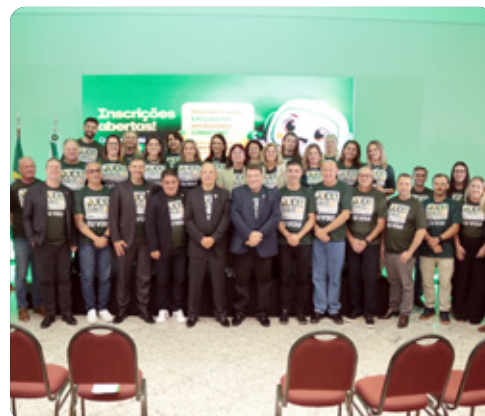
Comissão organizadora da Contesc 2026