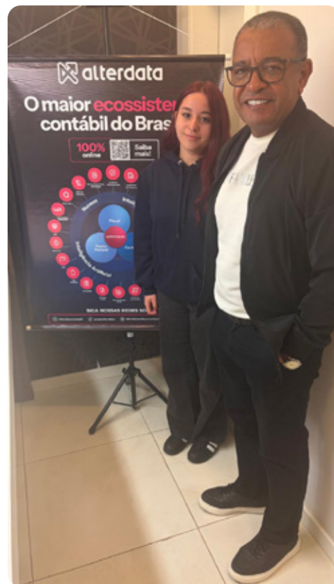
Chegada ao Oeste é resultado de um movimento de expansão aliado ao potencial econômico local

Entre os principais desafios enfrentados pelos contadores atualmente estão as constantes mudanças na legislação, o volume de obrigações acessórias