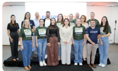
Comissão organizadora e palestrantes do Erccont 2026