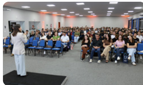
Evento foi direcionado para estudantes de Ciências Contábeis e contadores