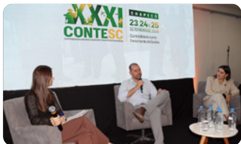
Palestras trouxeram atualizações para os estudantes e para os profissionais