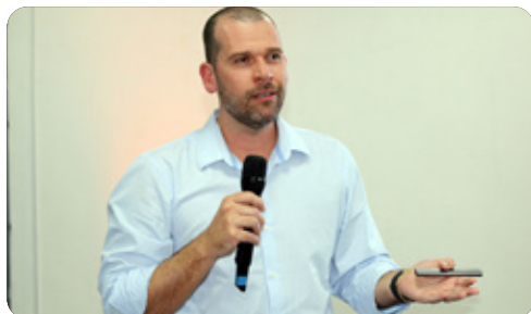
Erccont debateu reforma tributária no agro e inteligência artificial na contabilidade

O Erccont 2026 teve apoio da Fecontesc e da Questor Sistemas, patrocínio do Suco Prat's e da Thomson Reuters – Domínio, reforçando o compromisso coletivo com a qualificação e o fortalecimento da contabilidade no oeste catarinense.